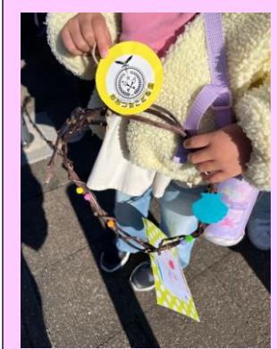
サツマイモのツルの再利用。とても素敵なりーヌの完成です☆