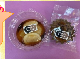
金成だんごはお豆腐で作られているので、お子さんもペロロと完食！「おいしいねえ♡」と何度も言ってこの笑顔♡