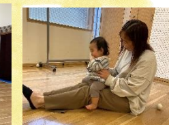
親子で楽しく運動教室☆ハイハイのお子さんから参加できますーす！！