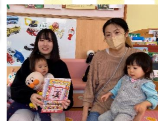
11月生まれのお友達のお誕生日のお祝い♡お芋ほりゲームで城山ポテトゲット☆