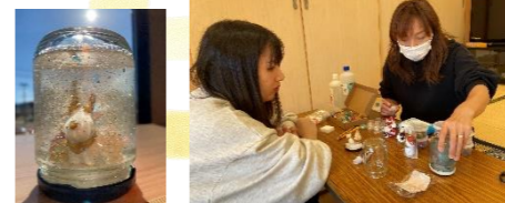
スノードームを作りました♡ママのセンスが光ります☆