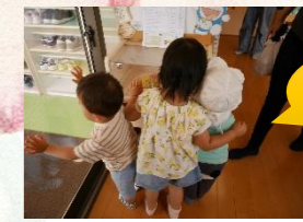
お給食 美味しそうだな～♡