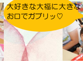
大好きな大福に大きなお口でガブリッ♡