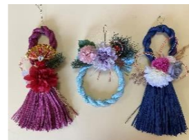
こんなにおしゃれなしめ縄を作りました！