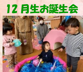
寒い日はあったかいお風呂で暖まる♡お風呂ごっこで大盛り上がり♡