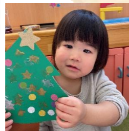
金と銀の星のスタンプを上手にペタペタしてツリーの完成🎄