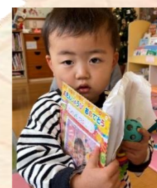
12月生まれのお友達のお誕生日のお祝い♡