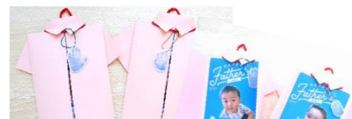
父の日のプレゼント 「手形キーホルダー&カード」 を作ったよ♡ パパいつもありがとう♡