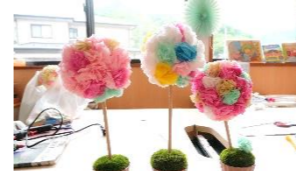
おしゃれなインテリア 「トピアリー」を作りました★