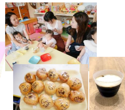
チャリカフェさんのおやつは 「おとうふドーナツと 豆から淹れたコーヒーゼリー」♡