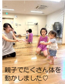
親子でたくさん体を 動かしました♡