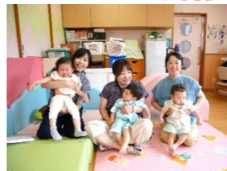
みなでお誕生日のお友達をお祝いしました♡ お菓子釣りゲームにも挑戦🍪みんな上手🍪