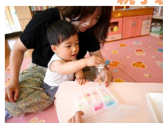
夏らしく、涼しげなセンサーボトルを作りました☆ ビーズを選んでつまんでボタンも上手にできました☆