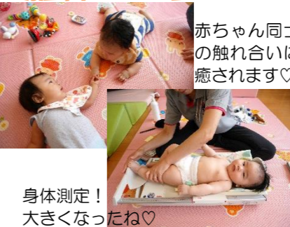
赤ちゃん同士の 触れ合いに癒されます♡ 身体測定！ 大きくなったね♡