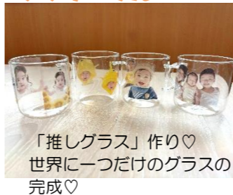
「押しグラス」作り♡ 世界に一つだけのグラスの完成♡