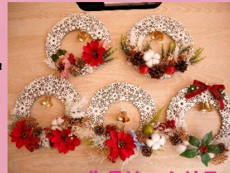
先月は…クリスマスリース作り