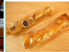
先月は…アップルパイとあんこパイ